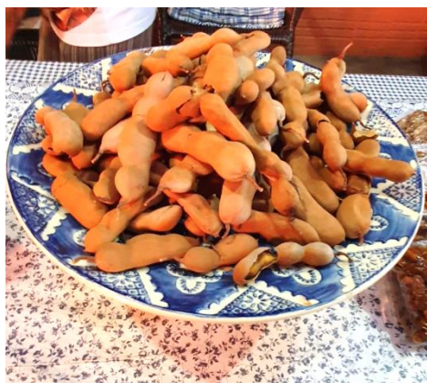
Figura 1 - Fruto do tamarindo

O tamarindo é o fruto do tamarindeiro, caracterizado por ser uma vagem alongada, protegida por casca pardo-escuro (Figura 1), lenhosa e quebradiça, contendo de 1 a 5 sementes lisas achatadas, envolvidas por uma polpa seca, de cor marrom e de sabor ácido-adocicado (PEREIRA et al., 2011).