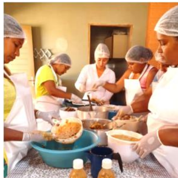
Figura 8 - Elaboração de produtos do tamarindo com moradoras do povoado, no projeto PAEmpl - 2019.

Ao passar dos anos, a colheita e consumo do fruto passou a ser uma atividade comum na comunidade e novas mudas de tamarindeiro foram plantadas. Diante dessa nova realidade, foi feita então, pela equipe do IF Sertão-PE, uma proposta de que os frutos pudessem ser beneficiados em escala semi-industrial e comercializados, com intuito de gerar renda complementar para as cinco mulheres engajadas no projeto (Figura 8).