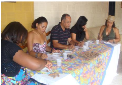
Figura 5 - Concurso de “Culinária do tamarindo” - edição 2011.