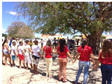
Figura 7 - Comunidade e visitantes em momento de oração pelo tamarindeiro, em 2018.