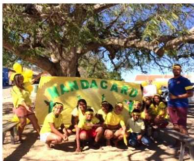
Figura 6 - Gincana cultural com crianças da comunidade à sombra do tamarindeiro em 2018.