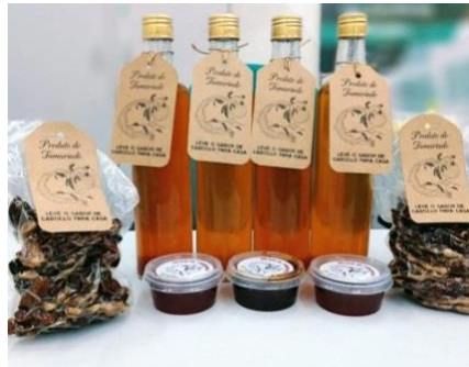
Figura 9 - Produtos do tamarindo produzidos e comercializados no projeto PAEmpl - 2019.